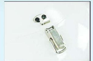
Gancho de bloqueo rápido