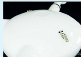
CF cubierta del fuselaje a prueba de lluvia y polvo.